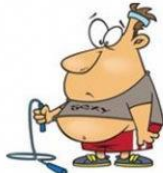
Ir al gimnasio