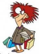
Ir de compras