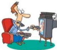
Ver la tele