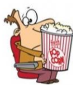
Ir al cine