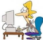
Navegar en Internet