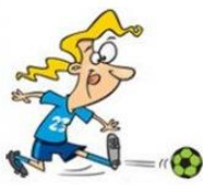
Jugar al fútbol