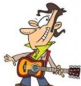
Tocar la guitarra